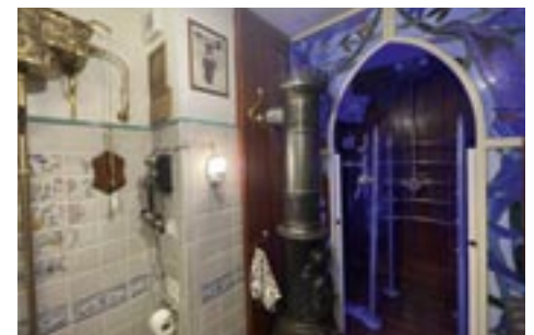
L'appartamento è abbellito da ampie finestre e porte con vetrate artistiche policrome a piombo ogni ambiente è stato curato nei minimi particolari. The apartment is enriched with wide polychrome stained-glass windows and doors. Each room has been carefully refined in every single detail.