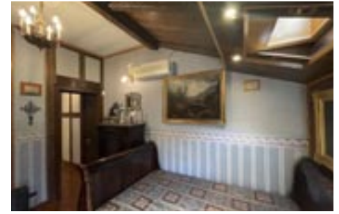
Una delle stanze riccamente arredate. One of the richly furnished rooms.